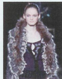
Grande madre Russia