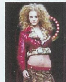
Il trionfo della pelliccia