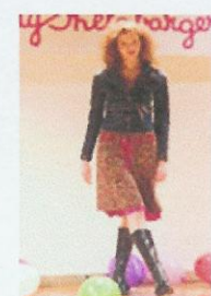
I video delle sfilate

trova >>> più di 3.000 voci: il più ricco database