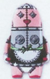
Gli stilisti? Tutti pupazzi!